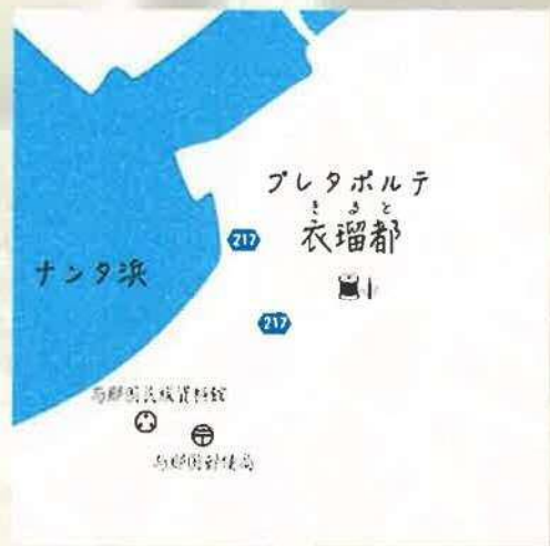
■プレタポルテ衣瑠都