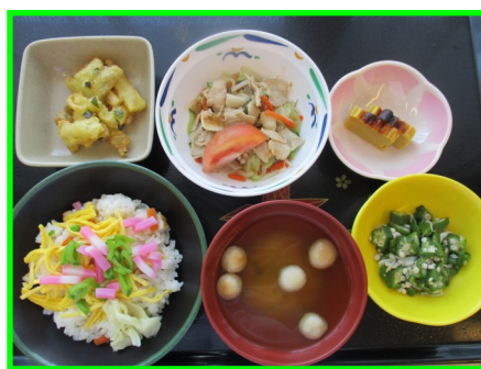
6月のイベント食（鹿児島の際）